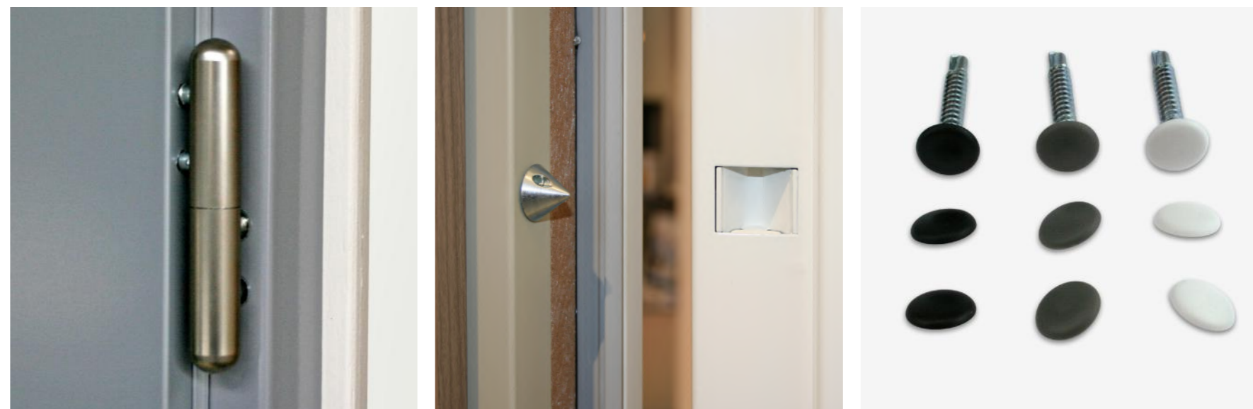
Fiche réglable 3D double broche avec cache-fiche

Meneau mobile pour permettre une ouverture aisée du semi-fixe